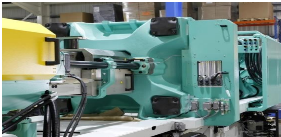
Ilustración 1 Moldeadora moderna