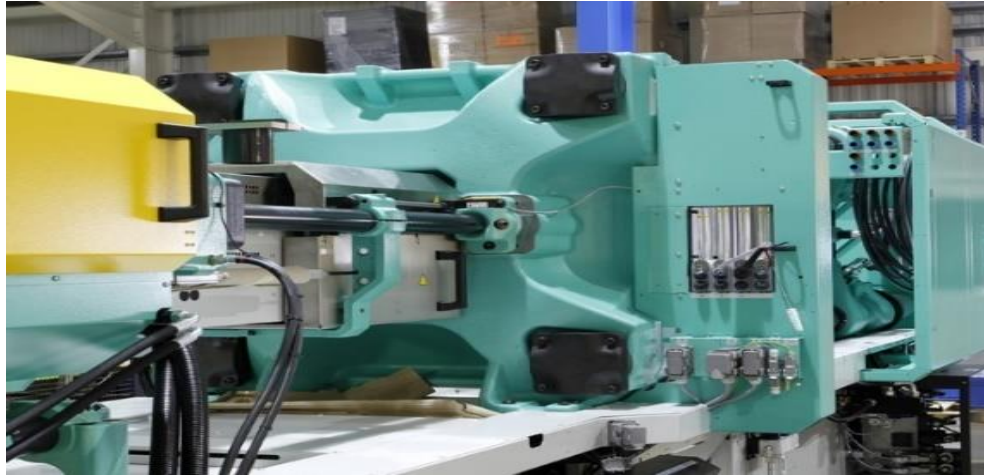
Ilustración 1 Moldeadora moderna