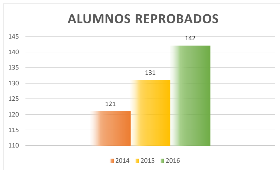
Gráfico 1. Número de alumnos reprobados

Durante el año 2014 Fase 1 fueron 121, en el año 2015 Fase 1 número de alumnos 131, año 2016 Fase 1 con 142.